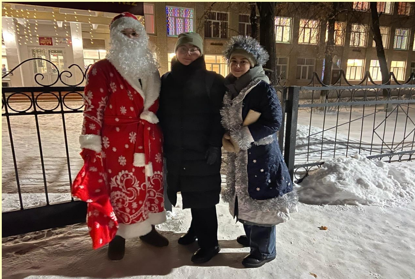
Встреча детей, Деда Мороза и Снегурочки